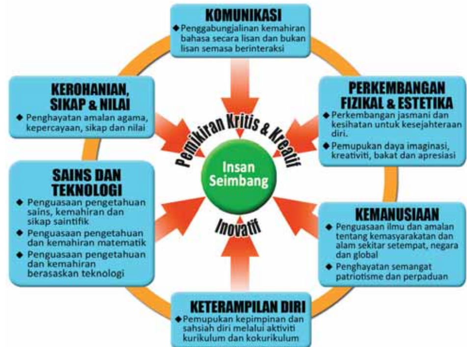
Rajah 1: Reka Bentuk Kurikulum KSPK dan KSSR